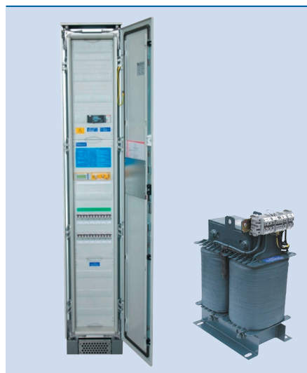
IT-System-Verteiler VIT-AFSBY mit energieeffizientem „Green Line“ Transformator

mit ATICS® Umschalt- und Überwachungsgerät, Isolationsfehlersuchgerät und Bypass-Schalter